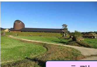
ラ・コリーナ敷地風景