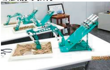
【注射器によるシリンダで水漏れ多発】