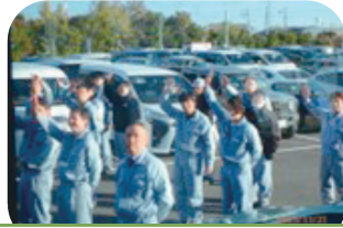
沢山の皆様に見送られて