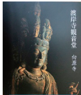
渡岸寺観音堂 向源寺