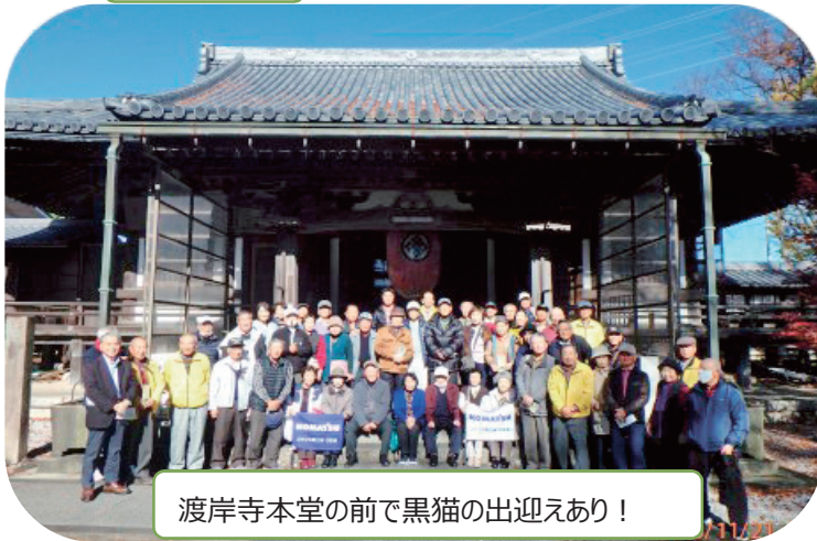
渡岸寺本堂の前で黒猫の出迎えあり！