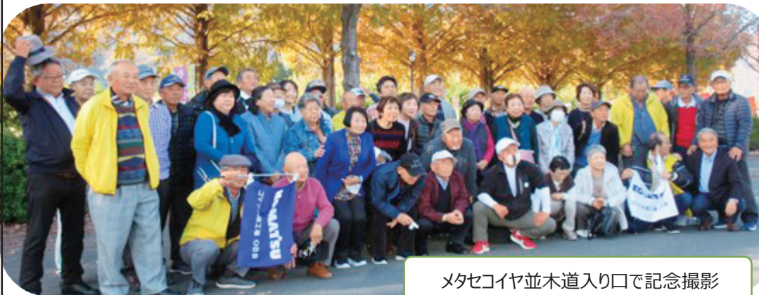
メタセコイヤ並木道入り口で記念撮影

◎ 須賀谷温泉は、里山雰囲気のある静かな温泉（入浴せず）で、料理は大満足でした。