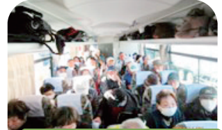
満席の為補助席使用