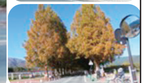
メタセコイヤ並木道

◎ 紅葉はもう少しでしたが、平日にもかかわらず、車・観光客も数多く見かけました。