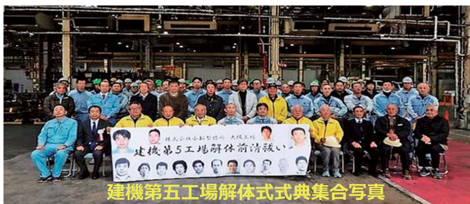
建機第五工場解体式式典集合写真