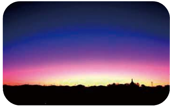
日の出のグラデーション